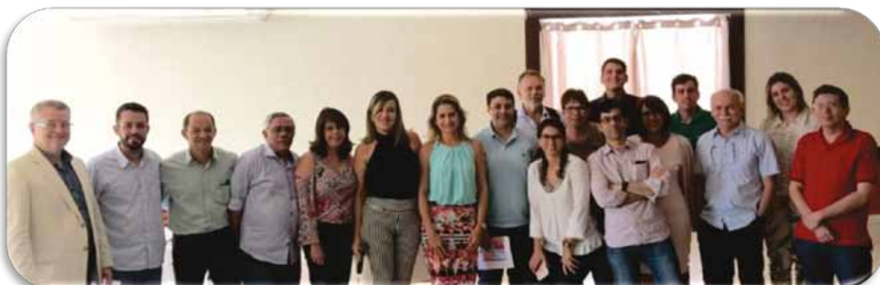
Clube da Imagem- Sucesso em Caruaru